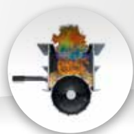
САМООЧИЩАЮЩАЯСЯ ЗАПАТЕНТОВАННАЯ ТОПКА